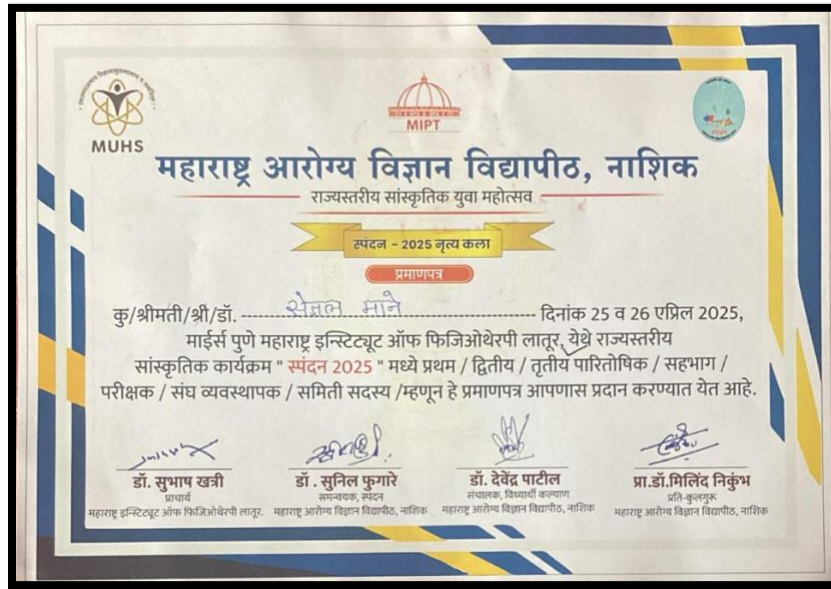
Certificate, Medal & Trophy for receiving 3 rd place